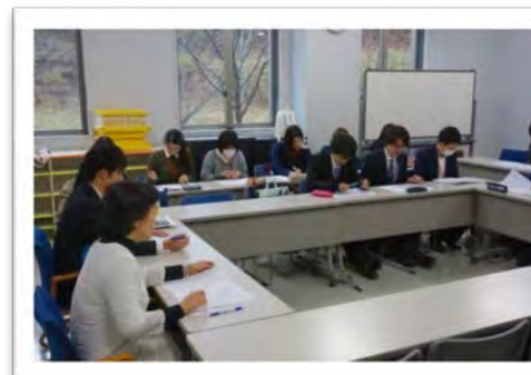
○合同ケースカンファレンス